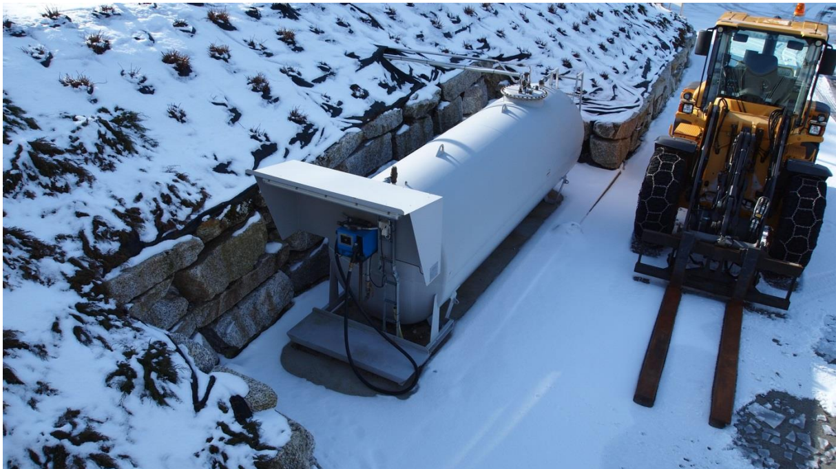
Bilde 4. God plassering av drivstofftank i forhold til fare for påkjørsler.