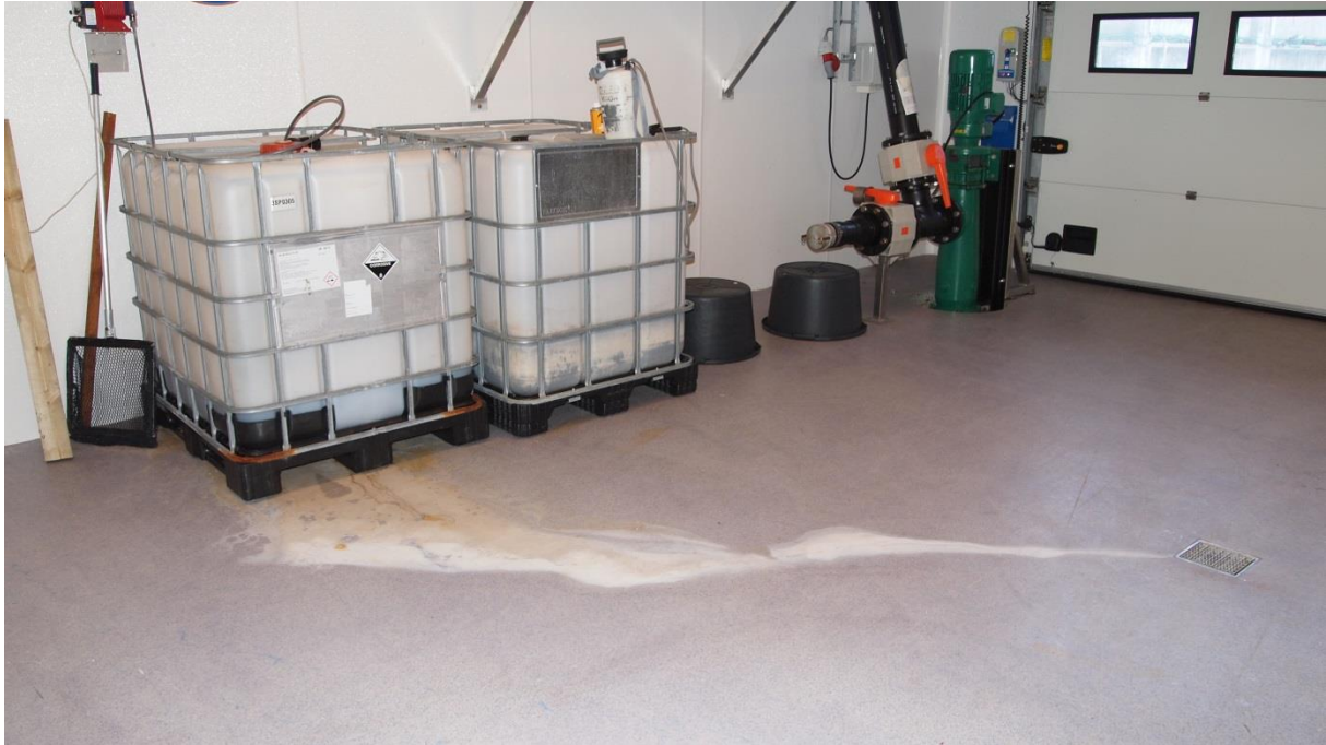
Bilde 1. Kjemikalier uten oppsamlingsmuligheter, og åpent sluk til avløp