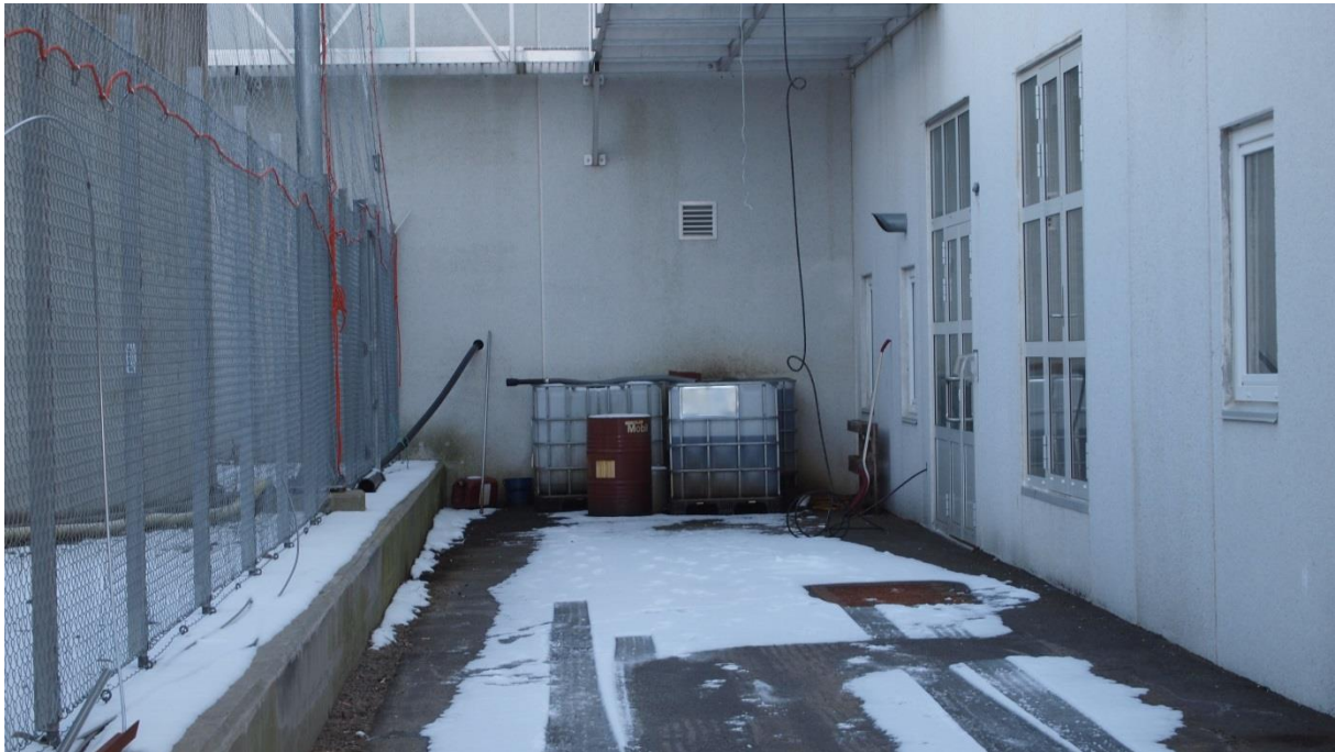
Bilde 3. Spillolje(farlig avfall) uten oppsamlingsmuligheter, merking, utsatt for vær og vind og ikke avlåst