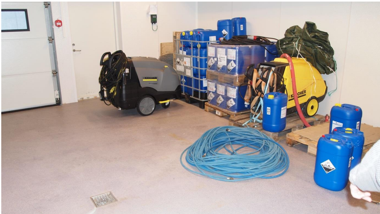
Bilde 2. Vaskemidler uten oppsamlingsmuligheter, og åpent sluk til avløp