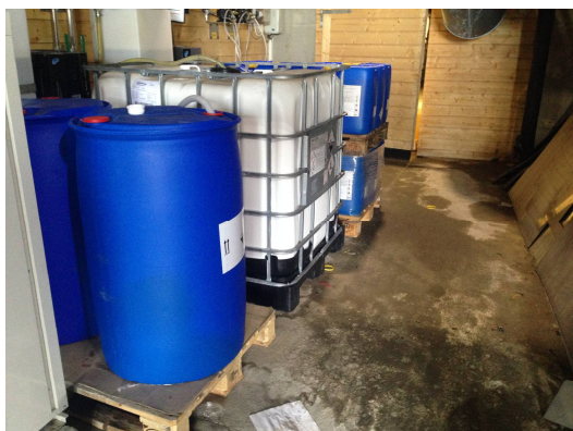
Bilde 1. Lagring av kjemikalier.

Bedriften lagrer diverse vaskemidler og desinfisering brukt til vasking av slakteriet, uten oppsamlingsmulighet, slik at uhellsutslipp kan gå til avløpet (bilde 1). Det er derfor nødvendig med tiltak for å sikre kjemikalierne mot uhellsutslipp til resipienten.