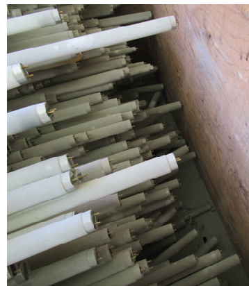
Bilde 1: Mellomlager lysstoffrør.

Norsk Stein AS har skiftet ut en stor mengde lysstoffrør som ledd i energiøkonomisering ved anlegget. Lysstoffrørene ble mellomlagret liggende i en stor kasse (bilde 1). Flere av lysstoffrørene i bunnen av kassen samt ett på toppen av denne var knust. Lysstoffrør inneholder mindre mengder kvikksølv, som ved knusing av rørene frigjøres og vil forurense ytre miljø.