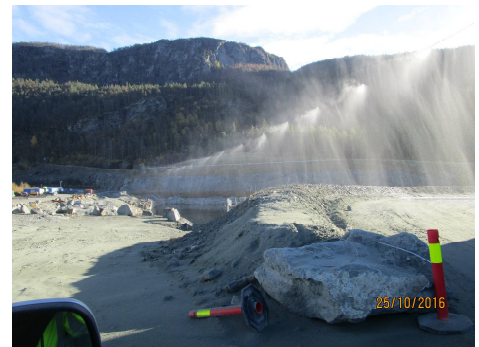
Bilde 6: Støvdempende vannvegg.

Etter Fylkesmannens vurdering har virksomheten gjennomført gode tiltak for å begrense støvflukten. Vi forutsetter at Norsk Stein AS i sine driftsmøter og ved årlig gjennomgang av internkontrollen iverksetter tiltak dersom nye forhøyde analyseresultater tilsier dette.