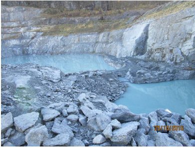
Bilde 3: Sedimenteringsbasseng.