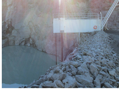
Bilde 4: Pumpestasjon.