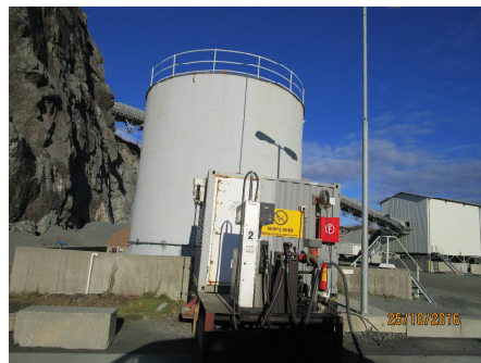
Bilde 2: Dieseltank med sikringsbasseng.

I henhold til forurensningsforskriften § 18-6 punkt c) Barrierer skal enkeltstående tanker ha et effektivt oppsamlingsarrangement som minst rommer tankens volum. For eksisterende tanker skal et slikt system være etablert innen 1.1.2019, jf. § 18-11 Overgangsregler .