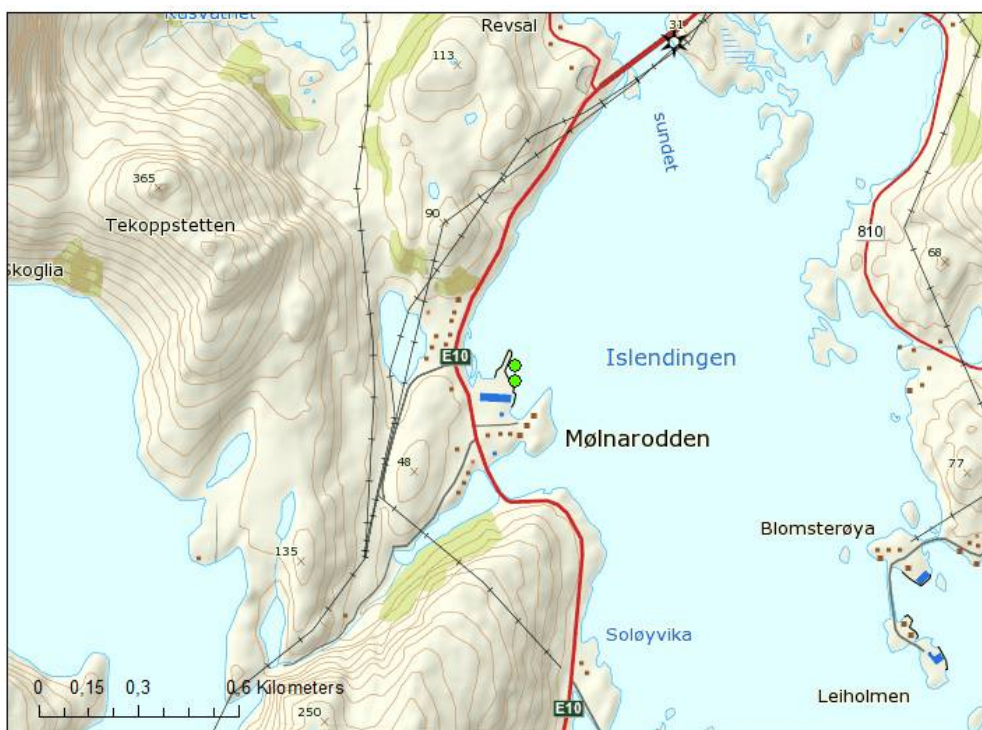
Figur 1. Oversikt over settefisklokalitet Mølmarodden. Utslippspunktet er oppgitt å befinne seg omtrent midt mellom de to grønne sirklene, som representerer to MOM B-stasjoner fra undersøkelsen i 2015. Selve anlegget ligger på land like sørvest for de to sirklene. Kart hentet fra ArcGIS.

Anlegget planlegger ifølge søknaden rensing av avløp. Den 14.7.2016 mottok Fylkesmannen imidlertid en søknad om utsettelse av renskrav på inntil 1 år ved eventuell innvilgelse av søknad. Selskapet begrunner dette med en misforståelse om at de kunne vente til søknaden eventuelt ble innvilget før de startet valg av utstyr. Silver Seed AS var per tidspunktet dispensasjonssøknaden ble mottatt i kontakt med flere leverandører angående renseløsninger.