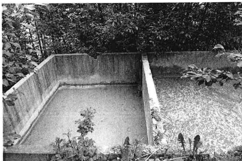
Figur 4 Overfylt sedimenteringsbasseng