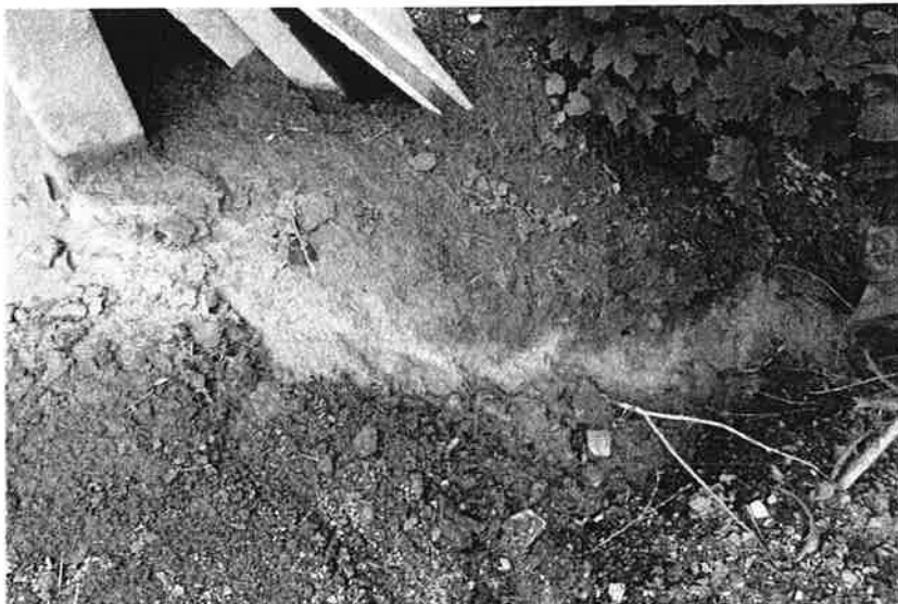
Figur 3 avrenning fra sedimenteringsbasseng ved betongstasjon

Ved oversittelse av fristen varsler vi en tvangsmulkt på kr 50.000,- .