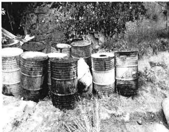
Figur 1 Oljefat lagret utendørs - avrenning

Fylkesmannen ser svært alvorlig på uforsvarlig håndtering av farlig avfall.