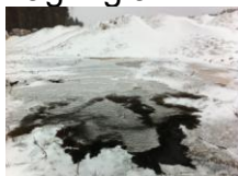
Avrenning fra lagring av "Alvamix" og sagstøv fra limplateproduksjon.