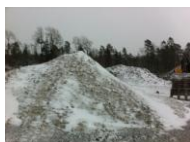
Lagring av "Alvamix" (bunnslam fra lagringstanker for cellulose)