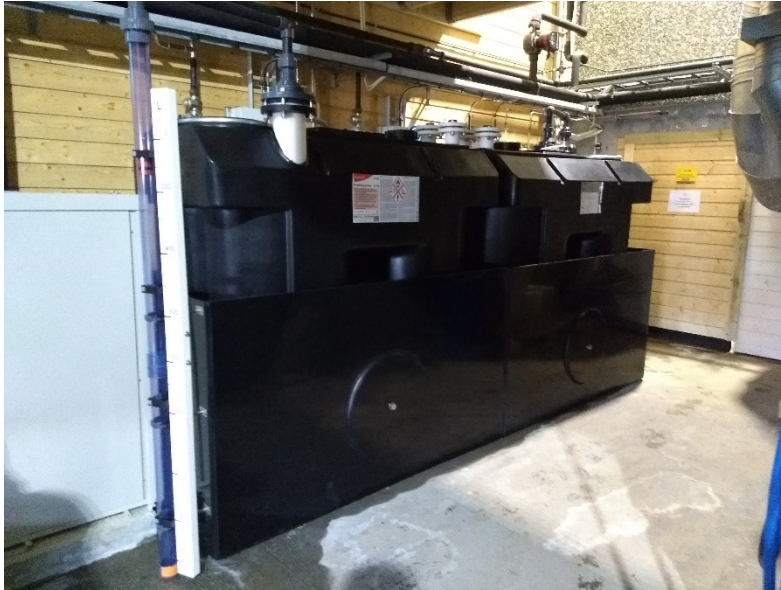
Bilde 1 Lagringstank.