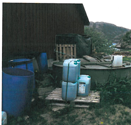
Oppbevaring av maursyre