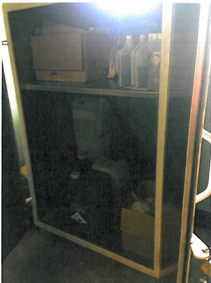
Oppbevaring av kjemikaliene