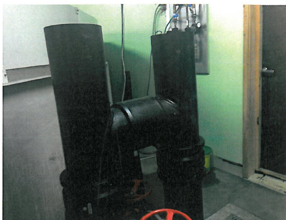
Avløpetrørene fra karene