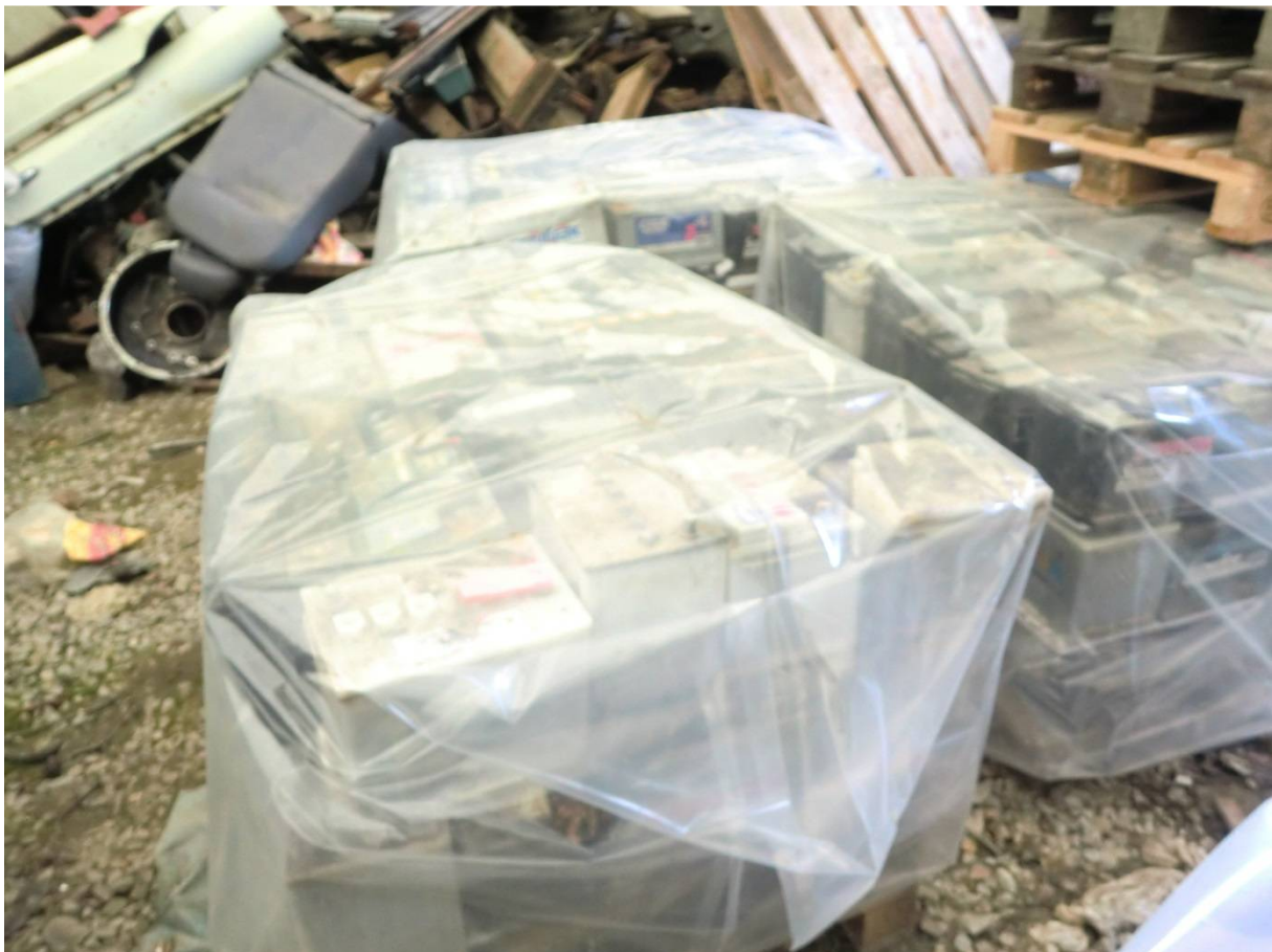
Bilbatterier lagret utenfor fast dekke.

Bedriften oppbevarte under tilsynet batterier utenfor tett dekke. Sprukne bilbatterier kan medføre avrenning av syre og bly.