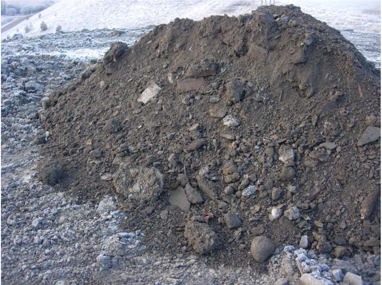
Foto 3: Nylig tippede gravemasser i østre del av deponiet. Anleggsvei til venstre for bildet.