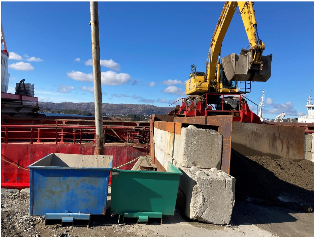
Bilde 3 De små grønne og blå containerne brukes til oppbevaring av masser som sopes opp etter at fartøyet har gått.

Det var videre ikke fastsatt i interne rutiner hvor raskt oppfeining av forurensete masser skulle skje ved nedbør.