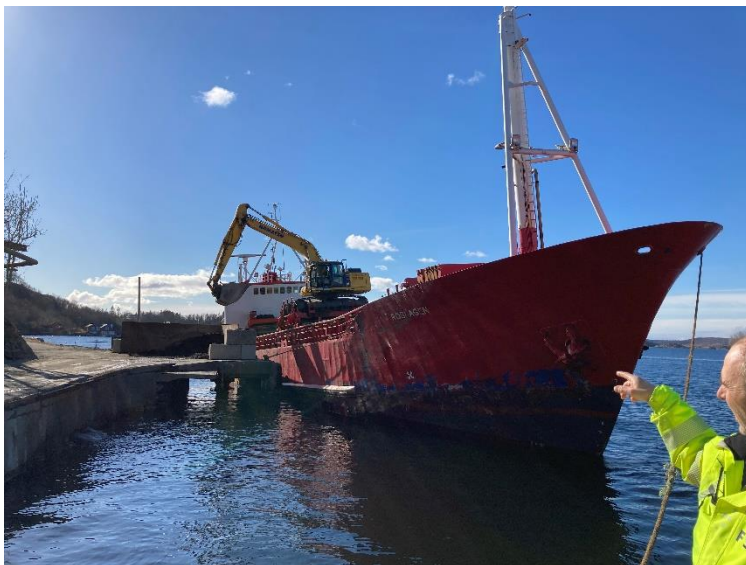
Bilde 1: Lasting

Fare for at forurensete jordmasser og avrenning kommer på sjøen ved lasting