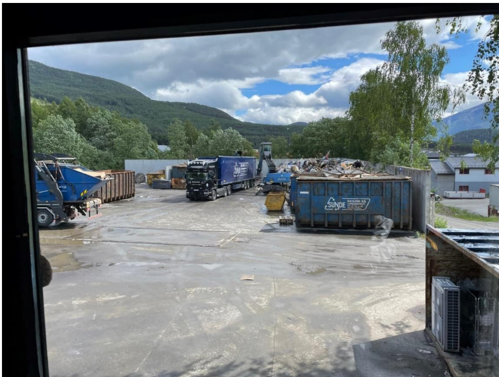
Figur 3: Det kjem nytt avfall inn samtidig som opplasting skjer fortløpande.

På tilsynsdagen var det verken personell eller nødvendig areal til å gjennomføre mottakskontroll av avfallet. På tilsynsdagen var også omløpshastigheita så høg at det ikkje var tid til å gå gjennom avfallet, sjå figur 3 under. Det blanda avfallet vart sendt vidare til kverning ved Sunde Resirk sitt anlegg i Årdal og så vidare til forbrenning som ordinært avfall. Ved kverning av blanda avfall på anlegget i januar 2021 tok det til å brenne fordi avfallet inneheldt eit batteri.