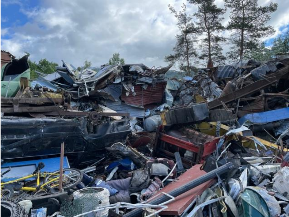
Figur 7: Viser kompleksmetall som det ikkje var noko mottakskontroll på.