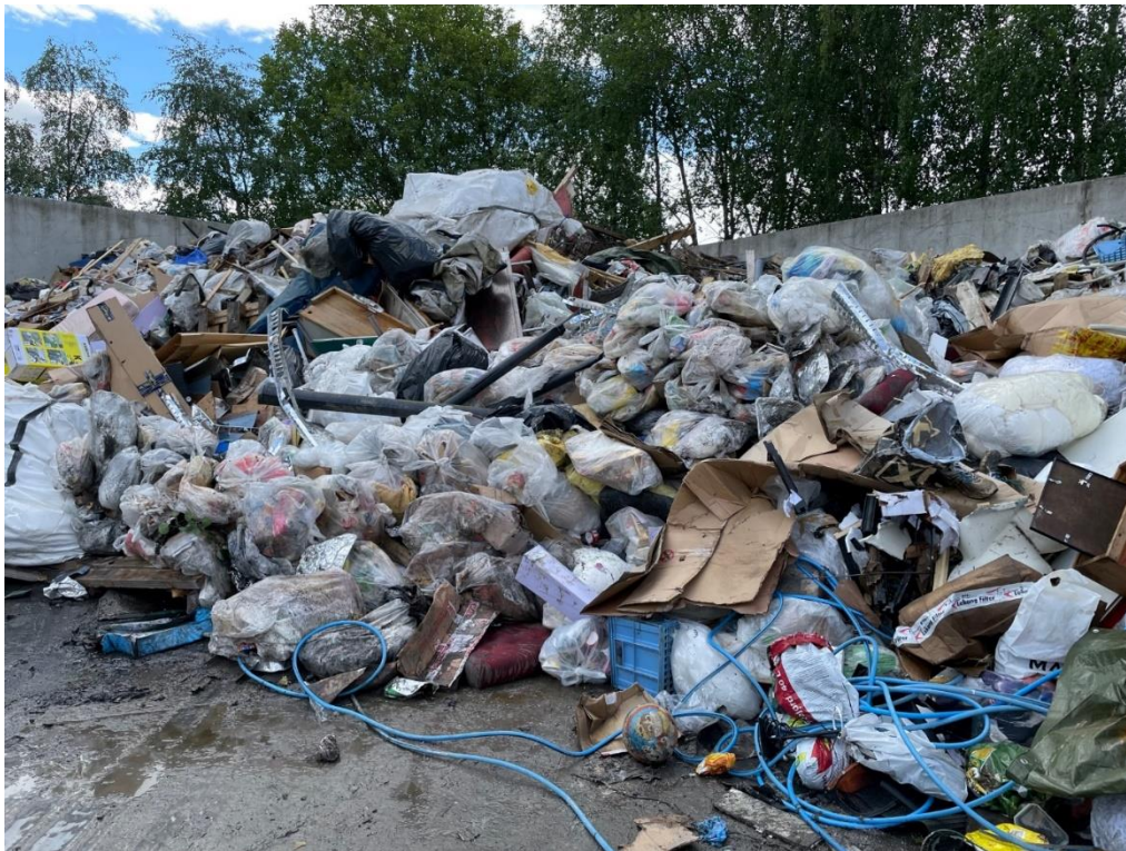
Bilde 6: Blanda næringsavfall som det ikkje var noko mottakskontroll på.

Dei tilsette på staden har ikkje sentrale ferdigheiter knytt til internkontroll slik som for eksempel avviksregistrering. Avvika over viser manglande kompetanse knytt til avfallsregelverket og løyvet.