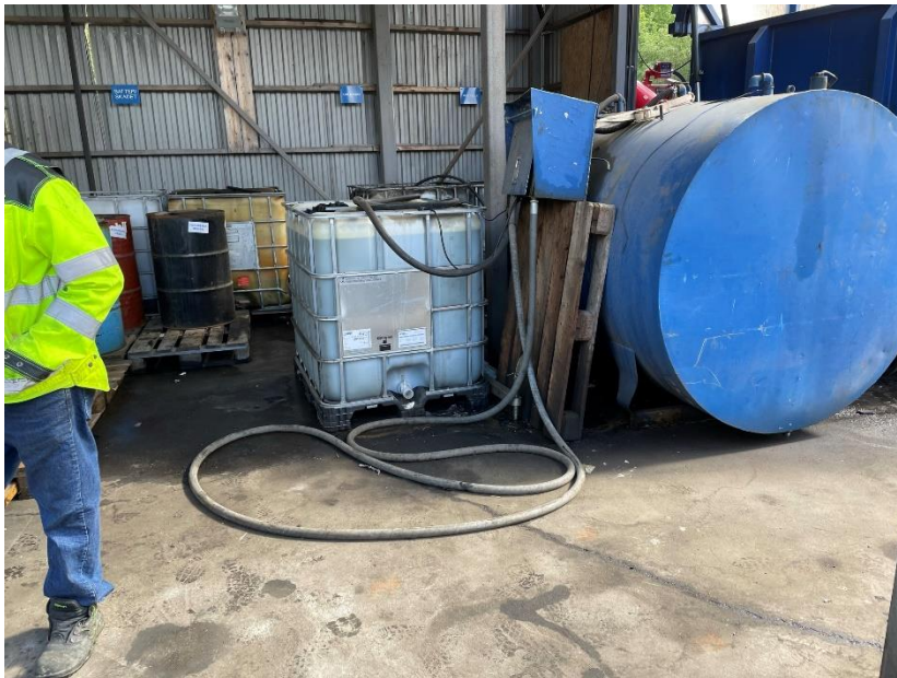
Figur 1: Organisering av lagringa av farleg avfall frå bilsaneringa gir risiko for utslepp.

Oppsamlingsarrangementet for farleg avfall frå miljøsaneringa gir risiko for utslepp, sjå figur 1. Lagring av tomgods gjer det vanskeleg å få til ein god organisering (figur 2). Farleg avfall skal ikkje lagrast slik at det ved ein uhellssituasjon går til utslepp via oljeutskiljar.