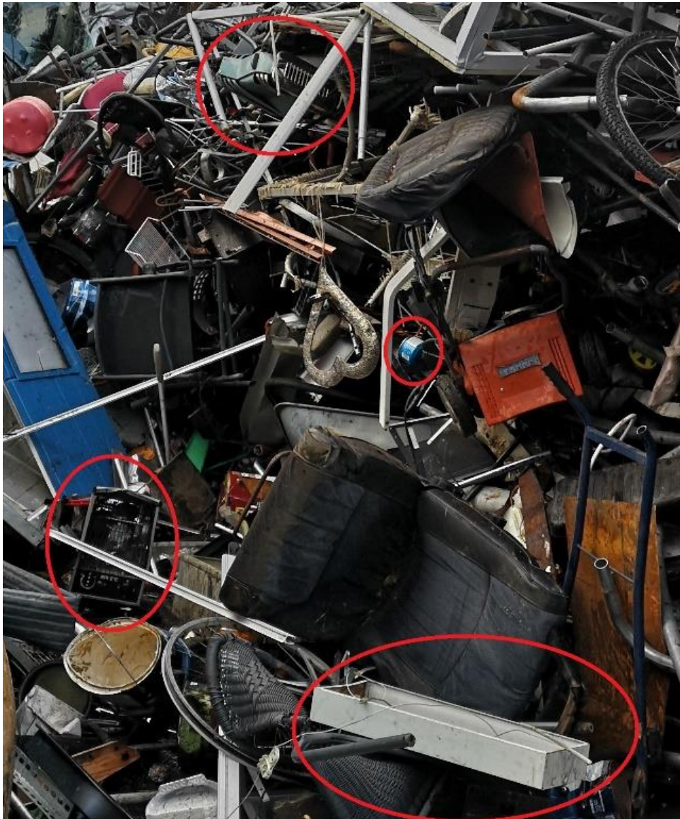
Figur 5: EE-avfall og farleg avfall i metallkompleks.