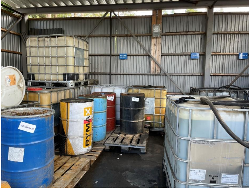
Figur 2: Tomgods som står til venstre i bilete kunne med fordel ha blitt flytta ein annan stad.