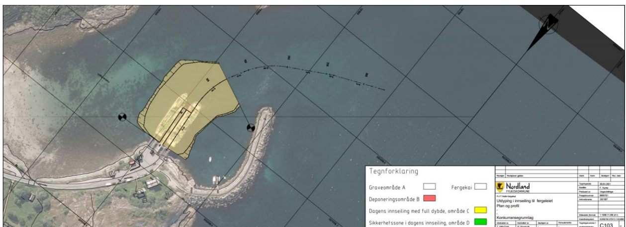
Figur 1 Holm ferlegeie i Bindal kommune. Området som skal mudres er markert i gult. Det skal også mudres langs den svarte streken. Karttegningen er hentet fra søknaden.

Tiltaket det søkes om omfatter mudring av omtrent 8200 m 3 sedimenter over et areal på 9200 m 2 . Mudringen skal utføres med lukket grabb fra lekter. Området som skal mudres er vist i Figur 1. Nordland fylkeskommune planlegger å frakte mudringsmassene til eiendom gnr. 14, bnr. 3 i Bindal kommune der grunneieren skal benytte massene til jordforbedring og utvidelse av jordbruksland. Området der massene skal disponeres er vist i Figur 2.