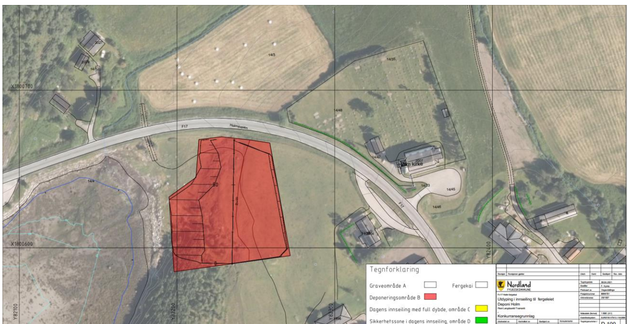
Figur 2 Området der mudringsmassene skal disponeres er markert i rødt. Karttegningen er hentet fra søknaden.