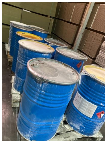
Figur 2: Bildet til venstre viser utendørs-lager under tak, men uten oppsamlingsarrangement. Bildet til høyre viser lagring innendørs, det var uklart hvor mye av dette som var farlig avfall. Avfall på begge lagringsplassene manglet god merking.