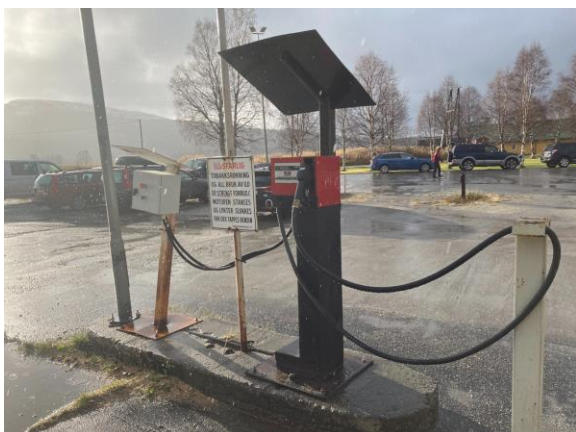
Figur 4: Dieselanlegg med nedgravd dieseltank på 12 000 liter

Nedgravde tanker er ikke omfattet av tanklagringsforskriften, men i henhold til internkontrollforskriften skal virksomheten ha risikovurderinger og rutiner for å avdekke og forebygge avvik. Under tilsynstidspunktet kunne bedriften ikke legge frem noen risikovurdering eller rutiner for kontroll med dieseltanken.