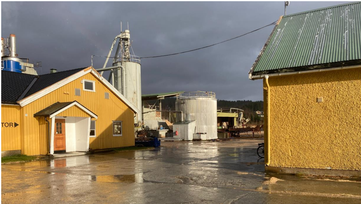
Figur 1: Bildet viser en eldre oljetank som er større enn 10 kubikkmeter

i kapittelet er oppfylt. Arbor AS ettersendte en miljørisikovurdering fra 2001 som inneholdt en grovanalyse på tanklagring av olje, men denne er utdatert og virksomheten må innføre rutiner for risikovurdering, drift, kontroll og beredskap for tanklagring iht. dagens krav i tanklagringsforskriften.