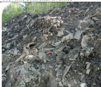
Mottatte masser med avfall