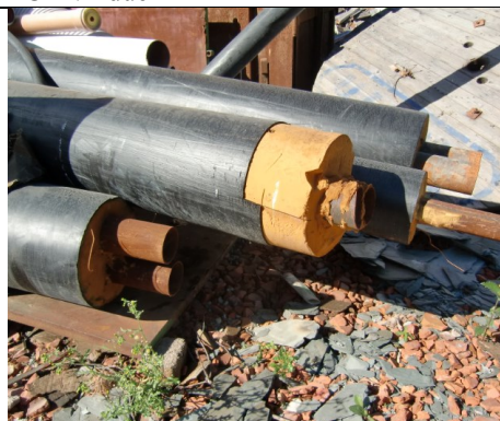
Cellegummi som rørisolasjon