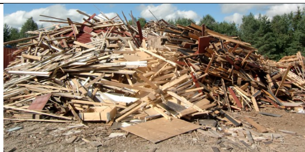
Trevirke som skal kvernes