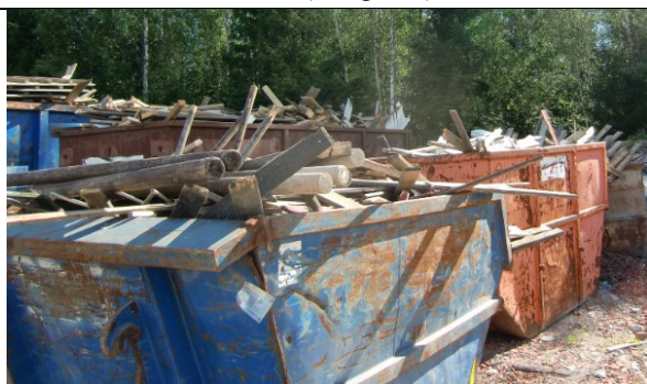
Impregneret trevirke; CCA og kreosot