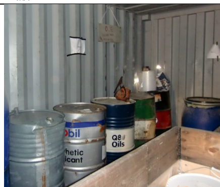
Flytende farlig avfall