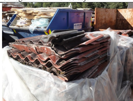
Eternitt med asbest