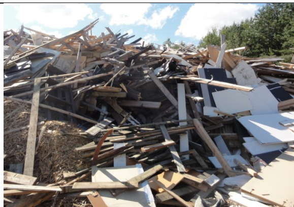
Trevirke som skal kvernes