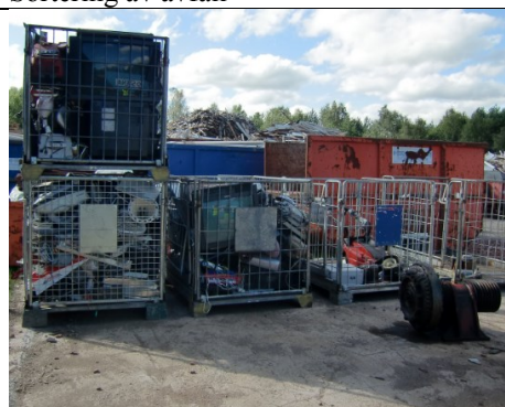
EE-avfall på betongdekke