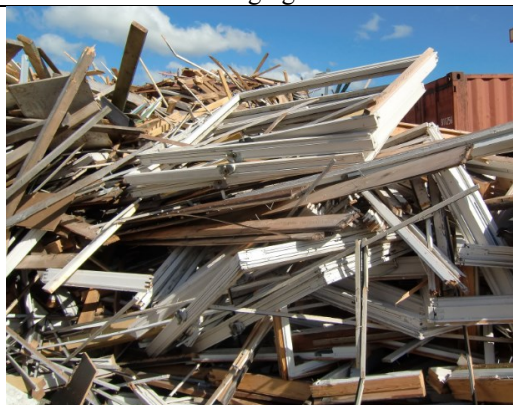
Vinduskarmer med PCB ( i fugelim)?