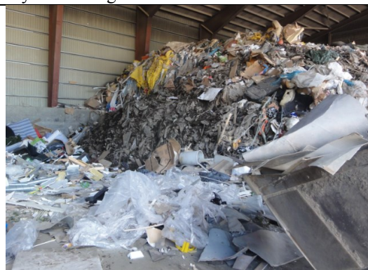
Sortering av avfall