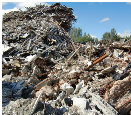
Rester av armert betong og trevirke