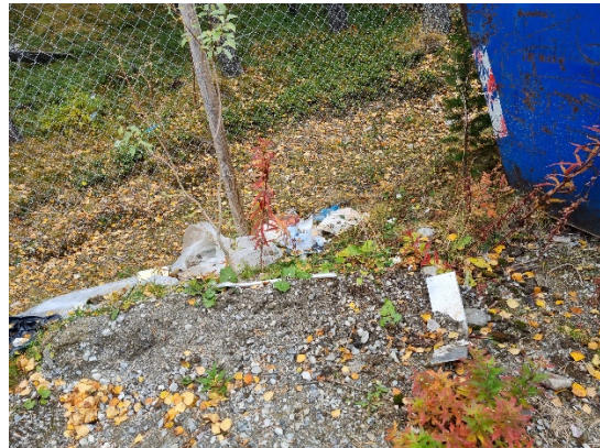
Bilde 2-5. Forsøpling på anlegget. (Foto: SFTL/Sigrid Drage).