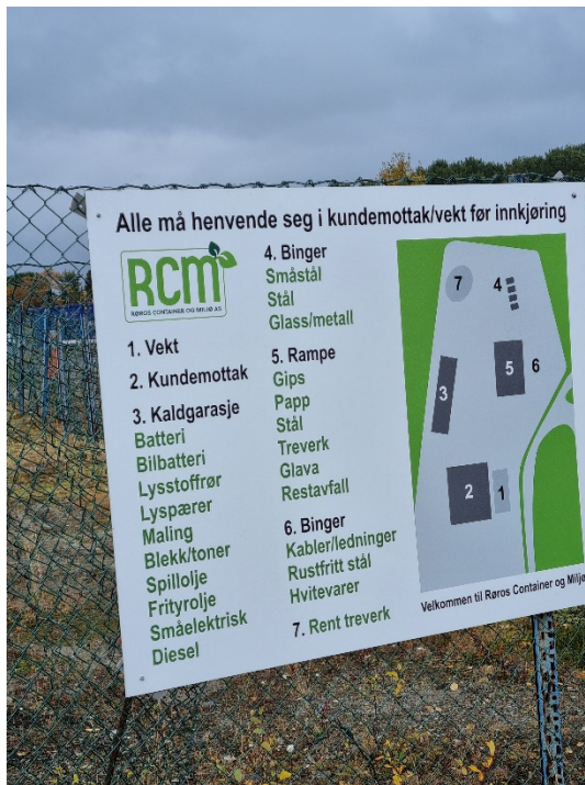
Bilde 1: Skilt ved innkjøring til anlegget (Foto: SFTL/Sigrid Drage).