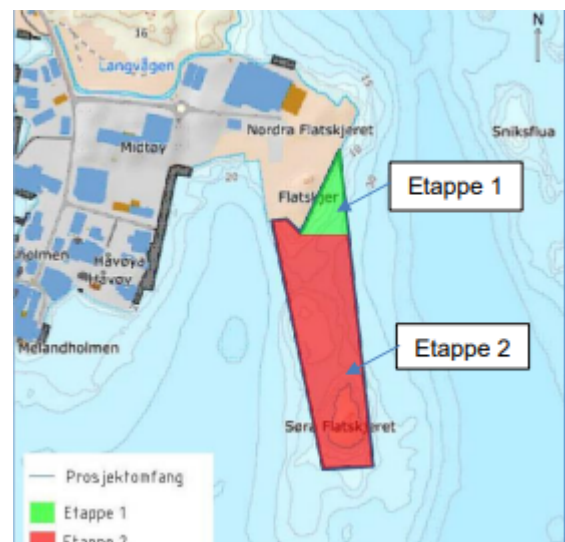
Figur 1. Etappe 1 og 2 illustrert i tiltaksområdet.

COWI avd. Stavanger søker på vegne av tiltakshaver Karmsund Havn IKS om å utvide havneområdet til den eksisterende havnen på Husøy i form av en containerterminal for Karmsund Havn IKS. Det søkes om en betydelig utfylling i sjø (etappe 2, figur 1) og peling av betongkai. Tiltaket i sin helhet forventes å være ferdigstilt innen 2026-2027.