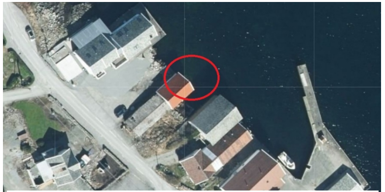
Figur 1: Omsøkt tiltaksområde er markert med rødt.

Det er registrert flere truede fuglearter i nærheten av tiltaksområdet, blant annet ærfugl (VU), fiskemåke (VU), gråmåke (VU) og hettemåke (CR) 3 .