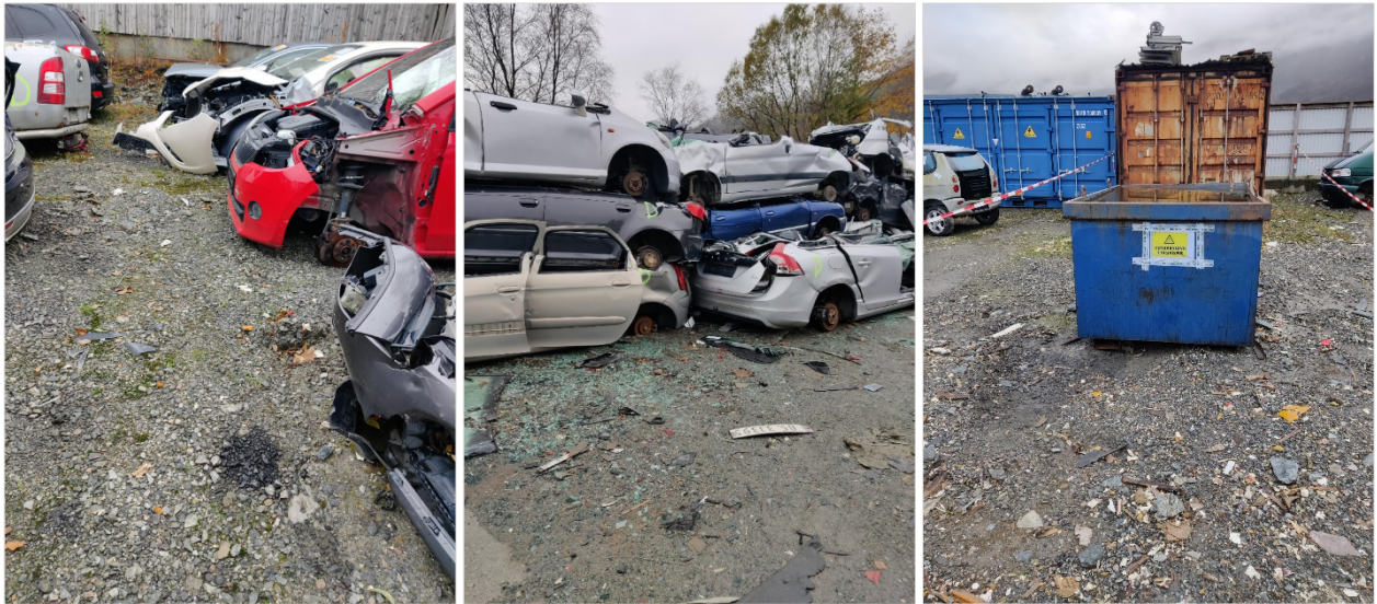
Figur 1-3. Bilde fra lagring av sanerte kjøretøy (1), lagring av delvis presset kjøretøy (2) og området hvor campingvogner håndteres (ved delplukk), hvor det nå var lagret ett batteri i vann pga. brannfare (3).

Kjøretøy ble ikke presset i bilpresse, men ble manuelt klemt med hjullaster, dette ble gjort på virksomhetens betongplate. Pressede kjøretøy ble deretter lagret på grusdekke, og lastet i containere for videretransport på samme området. Lagring og flytting til container av presset kjøretøy skal også ta sted på tett dekke da delvis-presset kjøretøy også er av fare for forurensning og forsøpling. Det var mye søppel, deler av plast, metall og glasskår på dette området.