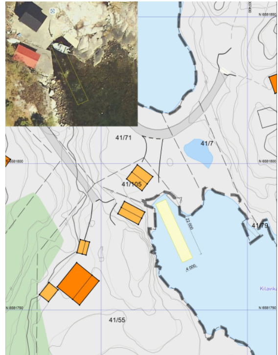
Figur 1 – Skisse tiltaksområdet. Figuren er hentet fra søknaden.

Muddermasser fra tiltaket skal ifølge søknaden gjenbrukes i prosjekter på land. Massene inneholder ifølge søker i hovedsak stein i fraksjonen 100-800 mm, samt noe finstoff.