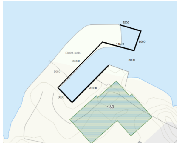
Figur 1 - Skisse av endring av molo. Figur er henta frå søknaden.

Søker skriv at det skal nyttast reine, lokale massar til utfyllinga, og at desse skal ha lagvis oppbygging med kjernemasse, filterlag og plastringslag, i samsvar med preakseptert løysning for molobygging.