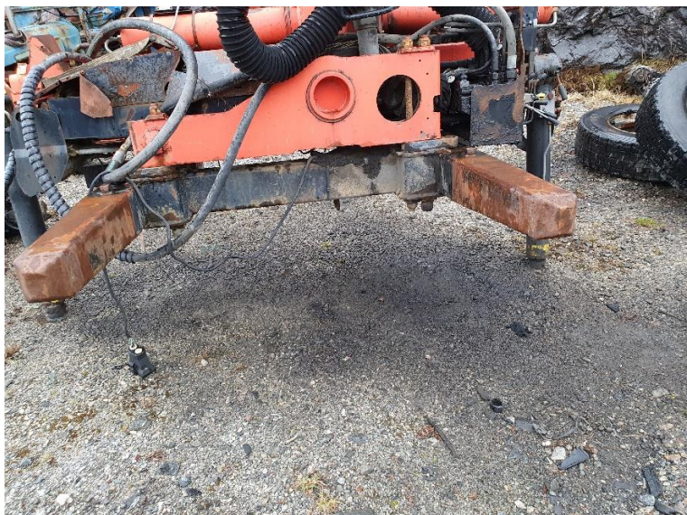
Bilde 6 Oljesøl på bakken