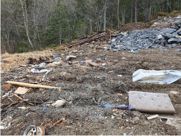
Bilde 11 Avfall i grunnen