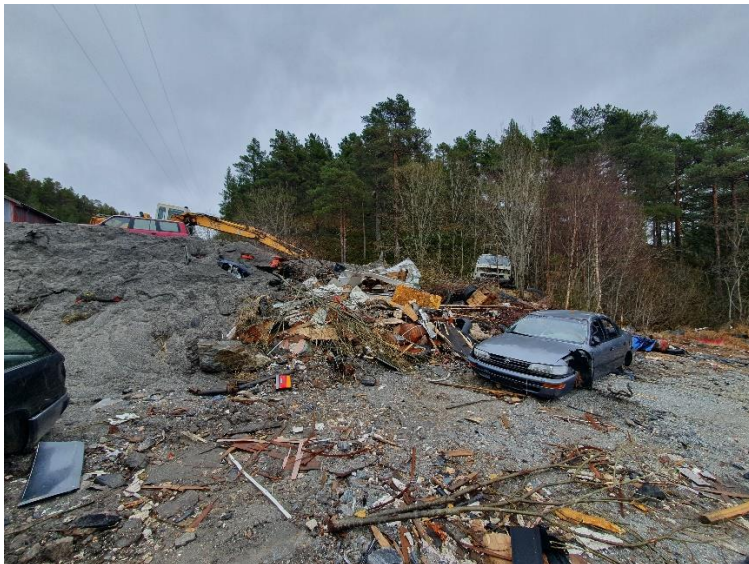
Bilde 9 Avfall skjøvet mot skråning