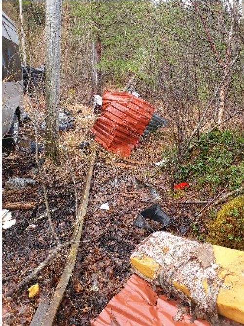
Bilde 4 Ødelagt gjerde