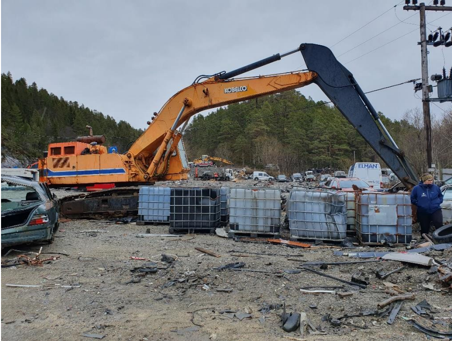
Bilde 3 Lagring av pressvæske