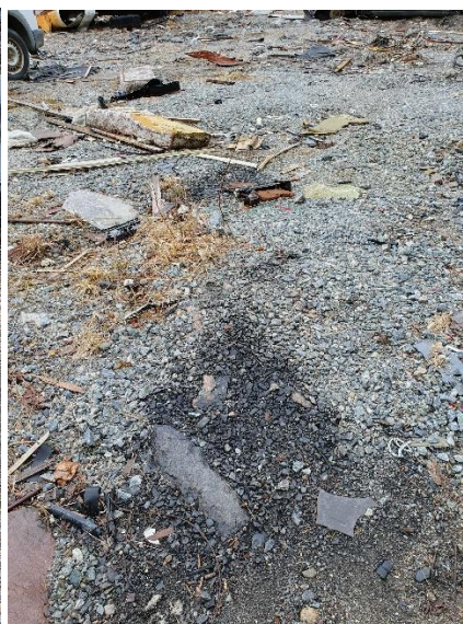
Bilde 7 Oljesøl på bakken