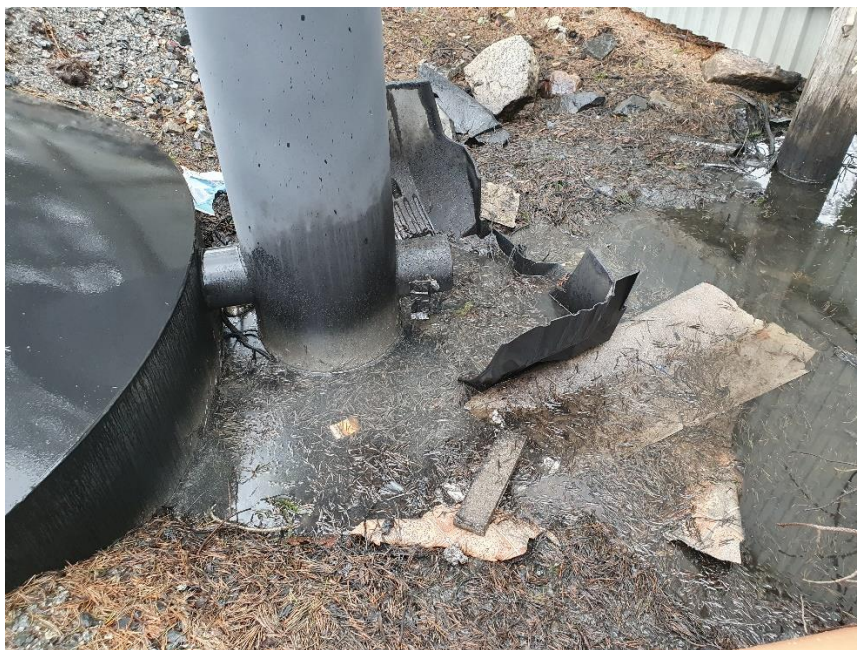
Bilde 8 Oljesøl ved oljeutskilleren