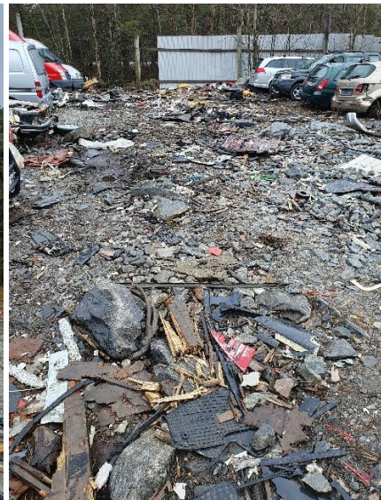
Bilde 10 Avfall i grunnen