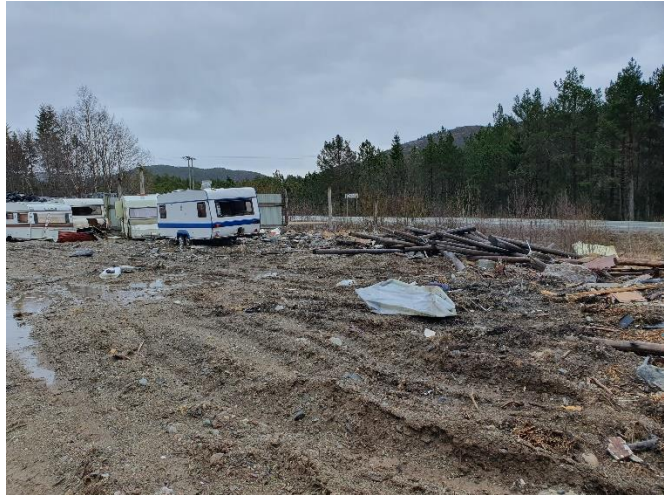
Bilde 5 Manglende gjerde