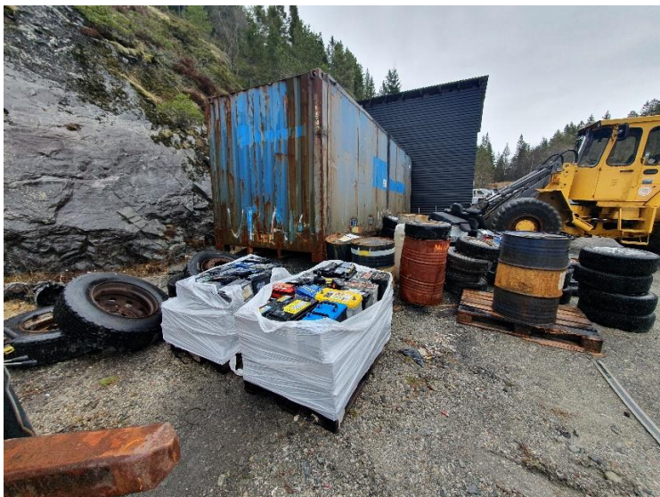
Bilde 1 Lagring av batteri til levering