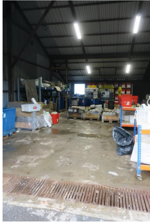
Rist ved inngangen til innandørs lager for farleg avfall.