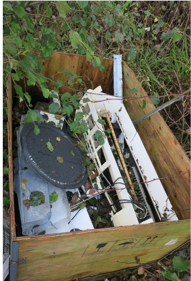
Kasse med EE-avfall i utkanten av området.