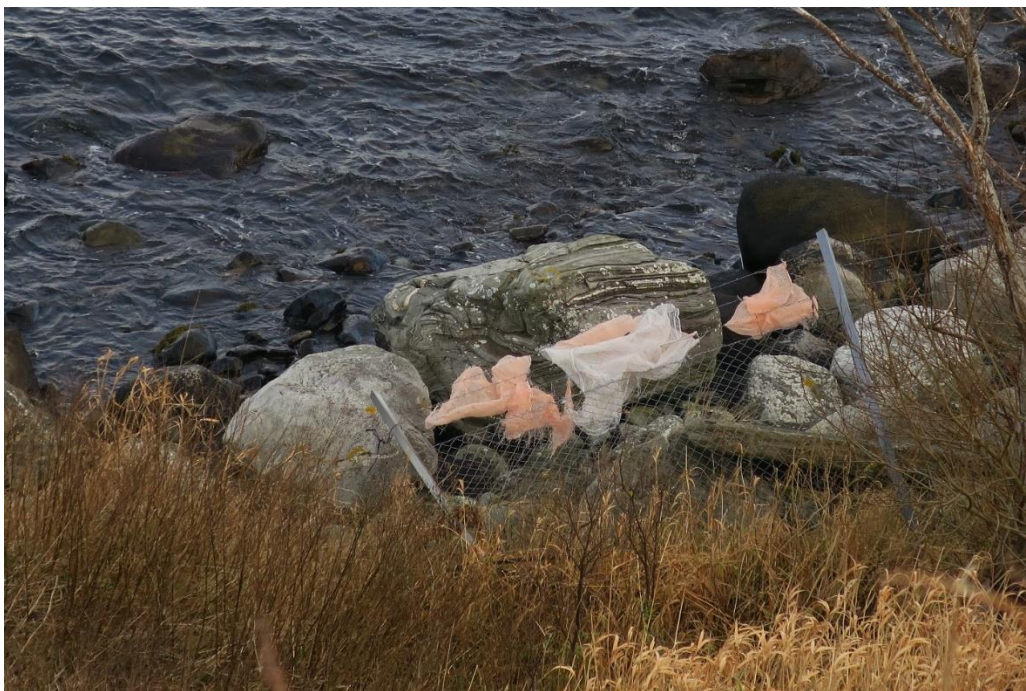
Plastavfall i gjerde ved sjøen.