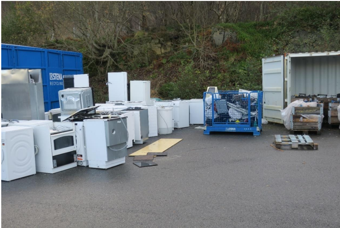
EE-avfall lagra ute utan sikring.