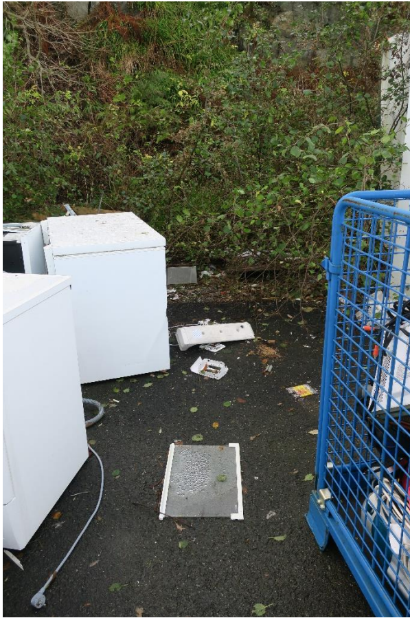
Restar frå EE-avfall på bakken.