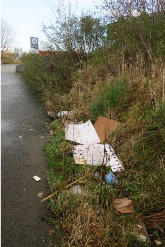
Forsøpling i grøft.