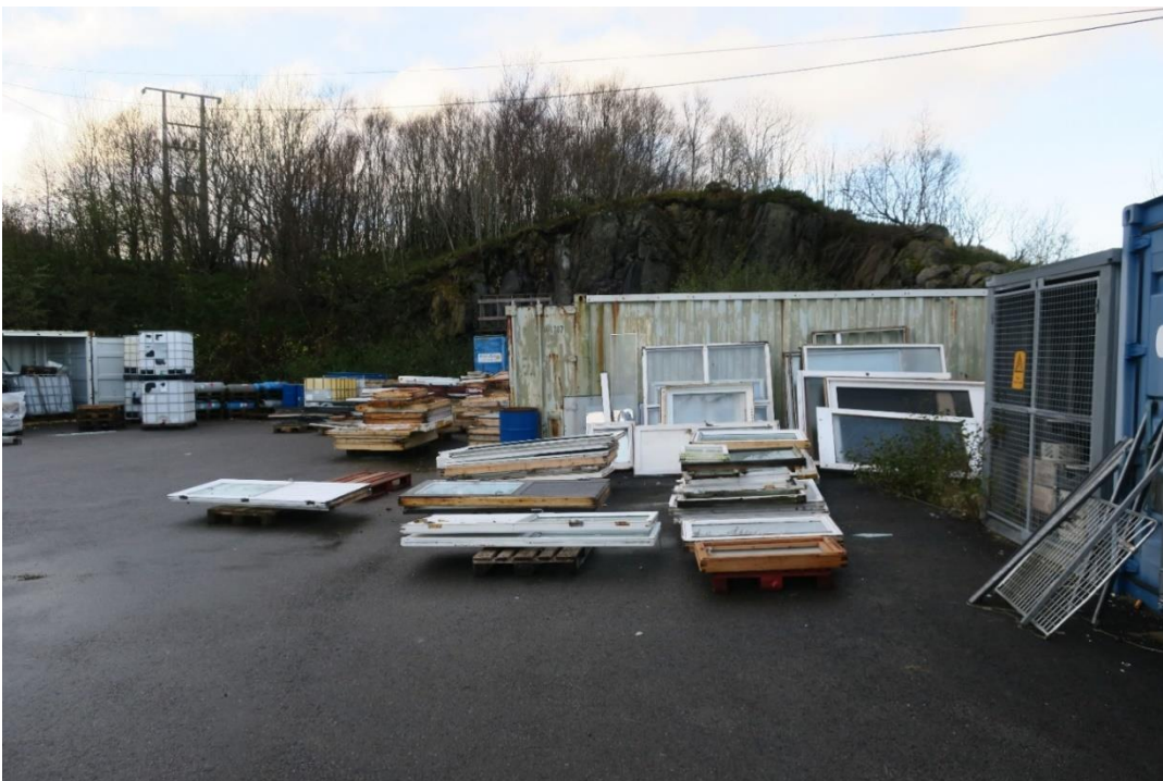
Utandørs lagring av vindauge. Fleire av stablane hadde vindauge med PCB eller klorparafin.