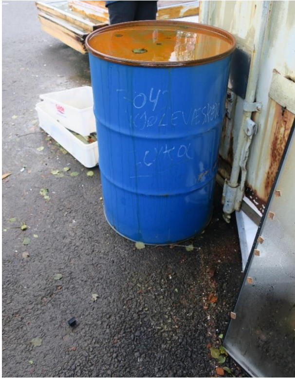
Fat med farleg avfall lagra ute utan sikring.