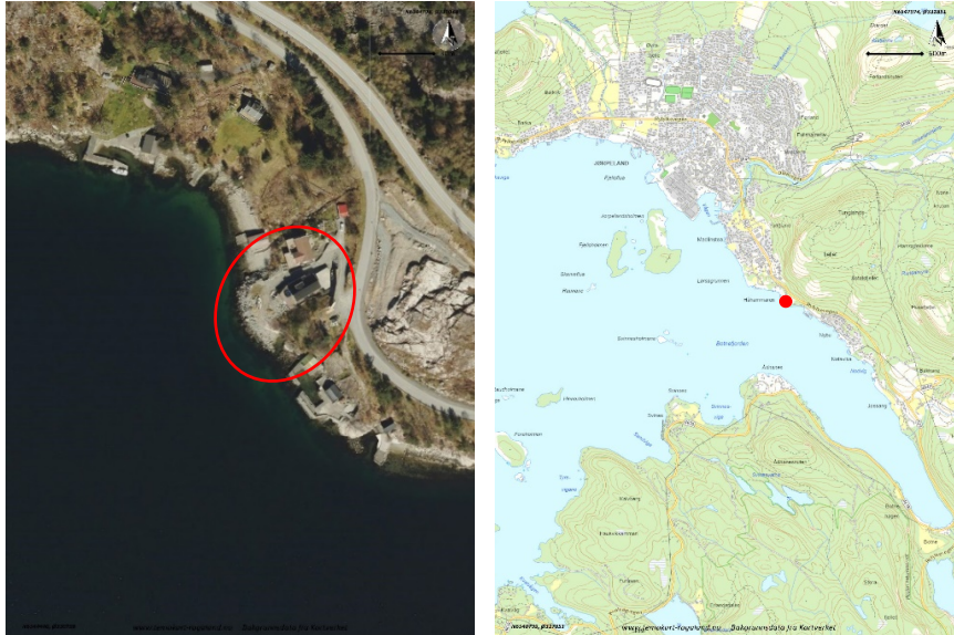
Figur 1: Flyfoto (t.v.) og oversiktskart (t.h.) over tiltaksområdet. Rød sirkel markerer tiltaksområdet på kartene.

Mudringen gjelder fjerning av utsprengte masser fra fjell i forbindelse med opparbeiding av tomt for bolig i 2012. Massene skal brukes til bygging av molo eller fyllmasser på samme byggetomt og arbeidet ønskes utført snarest.