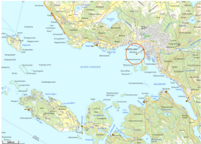
Figur 1. Plassering av Grytnes avløpsrenseanlegg med utslippspunkt (rød sirkel).

IVAR IKS søker i forbindelse med oppgradering av Grytnes renseanlegg, for å overholde kravet om primærrensing, om en utslippsramme på 30 000 pe. Det søkes om unntak fra sekundærrensing da resipienten er klassifisert som mindre følsom, og fordi undersøkelser tilsier at utslippet ikke vil medføre skadevirkning på miljøet. Utslipp av rensset avløpsvann planlegges på 40 - 50 meters dyp, ca. 500 m fra land ( Error! Reference source not found. ).