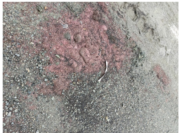
Figur 2. Brukt blåsesand

Under befaring observerte Statsforvalteren rester av brukt blåsesand på bakken (se bilde 2). Brukt blåsesand er i avfallsforskriften forhåndsdefinert som farlig avfall. Blåsesand skal håndteres som farlig avfall, med mindre virksomheten kan dokumentere at den ikke inneholder farlige stoffer over grenseverdiene for farlig avfall i avfallsforskriften kapittel 11. Blåsesand, enten som ordinært avfall eller farlig avfall, skal håndteres forsvarlig. Farlig avfall på avveie kan føre til at miljøgifter spres i naturen og skader dyr og mennesker.