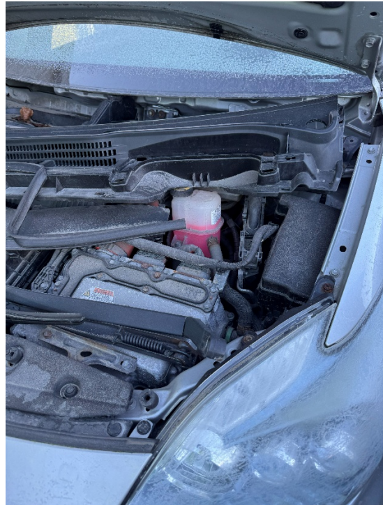
Bilde 3: Kassert kjøretøy før behandling (område 2).