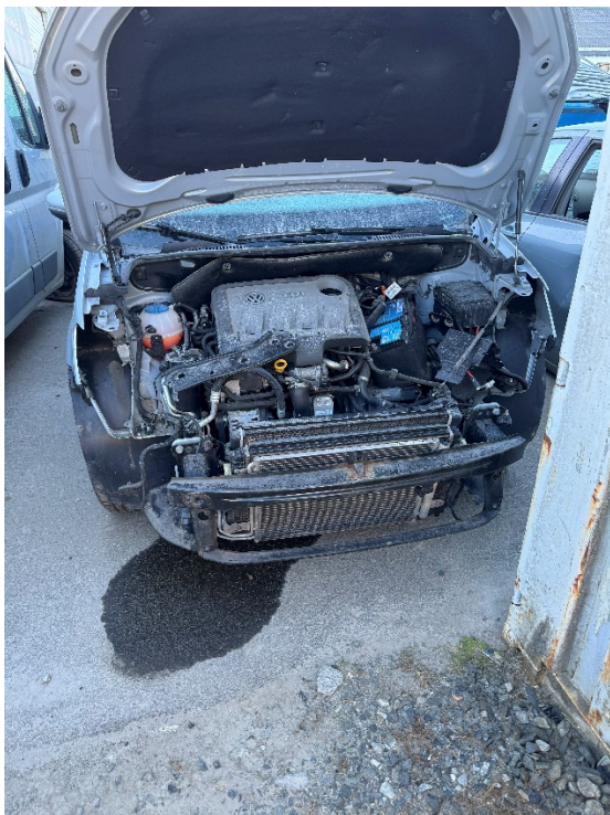
Bilde 4: Kassert kjøretøy før behandling på område 3. Bilen står på asfaltdekke som grenser mot grus. Som vist på bilde har det forekommet en lekkasje.