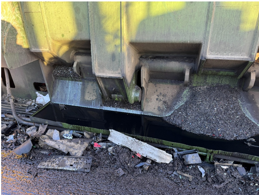
Bilde 7: Overfylt renne på bilpresse.

Under tilsynet ble det observert mye olje rundt bilpressen. Pressevæske samles på en IBC ved at det pumpes opp fra et kar tilknyttet pressen, men det var dårlig tilsig til dette karet. Karene som samler opp søl og pressevæske var isteden fulle, og det var tydelig at væsker hadde rent over kanten (Bilde 7).