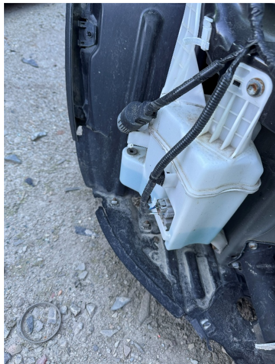
Bilde 5: Lagring av kjøretøy før behandling på grusdekke på område 4.