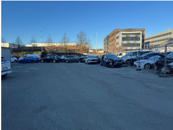
Bilde 2: Kø av vrakbiler utenfor resepsjonen som ikke var tatt inn på behandlingsanlegget (område 1).