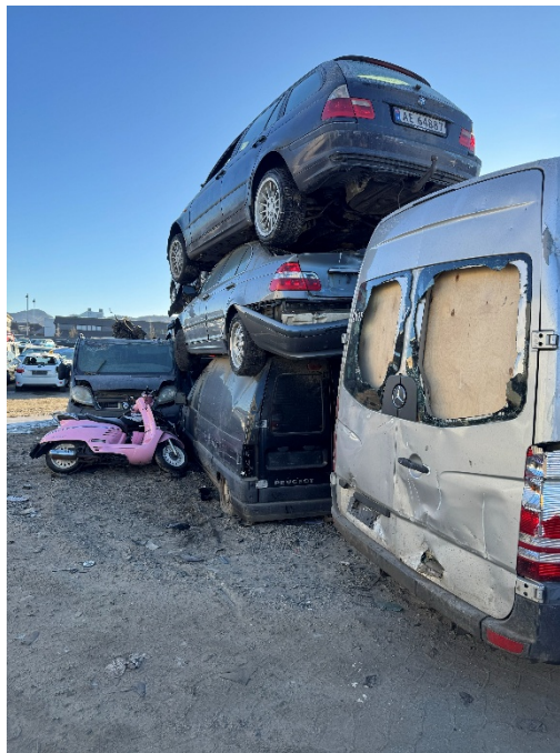
Bilde 6: Midlertidig lagring av biler før miljøsanering utenfor miljøhallen på grusdekke.

Statsforvalteren ser alvorlig på at virksomheten fortsatt opprettholder en praksis med å lagre kasserte kjøretøy før behandling i brudd med gjeldende regelverk. Vi setter frist til 15.10.2026 med å gi tilbakemelding på hvordan avviket er rettet, men understreker at dere må lukke det så fort som praktisk mulig. Vi viser videre til varsel om vedtak om pålegg om stans av mottak av kasserte kjøretøy, der vi ber dere sende oss en plan for retting av avviket innen 15.06.2026.